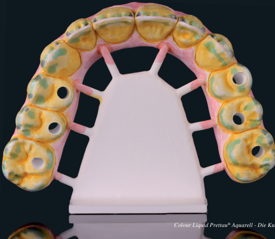
Colour Liquid Prettau® Aquarell - Die Kunst des Einfärbens von Zirkon